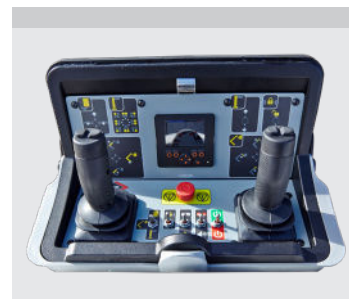
FPC (Fuldprop. CANbus-styring): Variabelt udlæg (med vejecelle) og op til 4 funktioner ad gangen (2 per joystick)