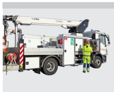
Opbevaringsskabe the chassiset (option)