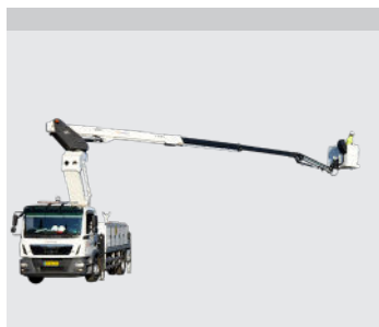
Adgang til arbejdsområder op og over forhindringer