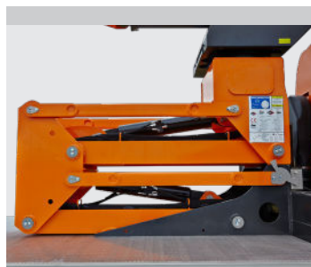
Lift-elevator (3 m)